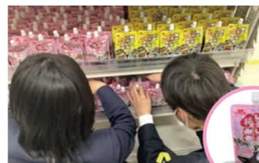
この商品はイオン各店舗で販売されました。

イオンリテール(株)と協働し、実際のビジネスを学び、その一環としてイチビキ(株)と「献立いろいろ梅みそ」を開発しました。